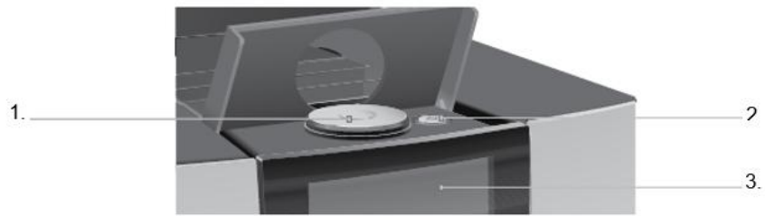
1. Rotary Switch